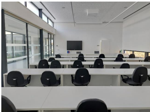
Slika 5. Edukacijska/konferencijska dvoran