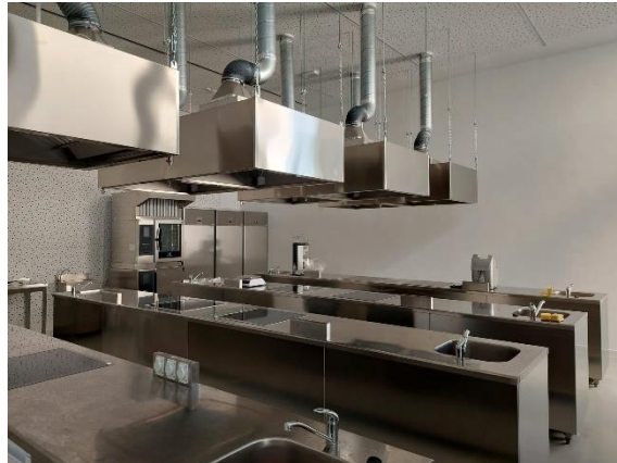
Slika 6. Edukacijska kuhinja