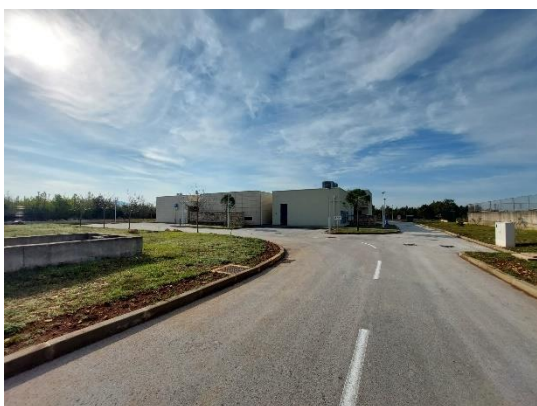
Slika 3. i 4.: Ruralni poduzetnički inkubator Krka Kistanje

Vizija Inkubatora je da kao regionalno središte kompetencija promiče razvoj, inovacije i poduzetništvo u poljoprivredno-prehrambenom sektoru i gastronomiji, kroz strateško partnerstvo i suradnju, u cilju daljnjeg razvoja zajednice.